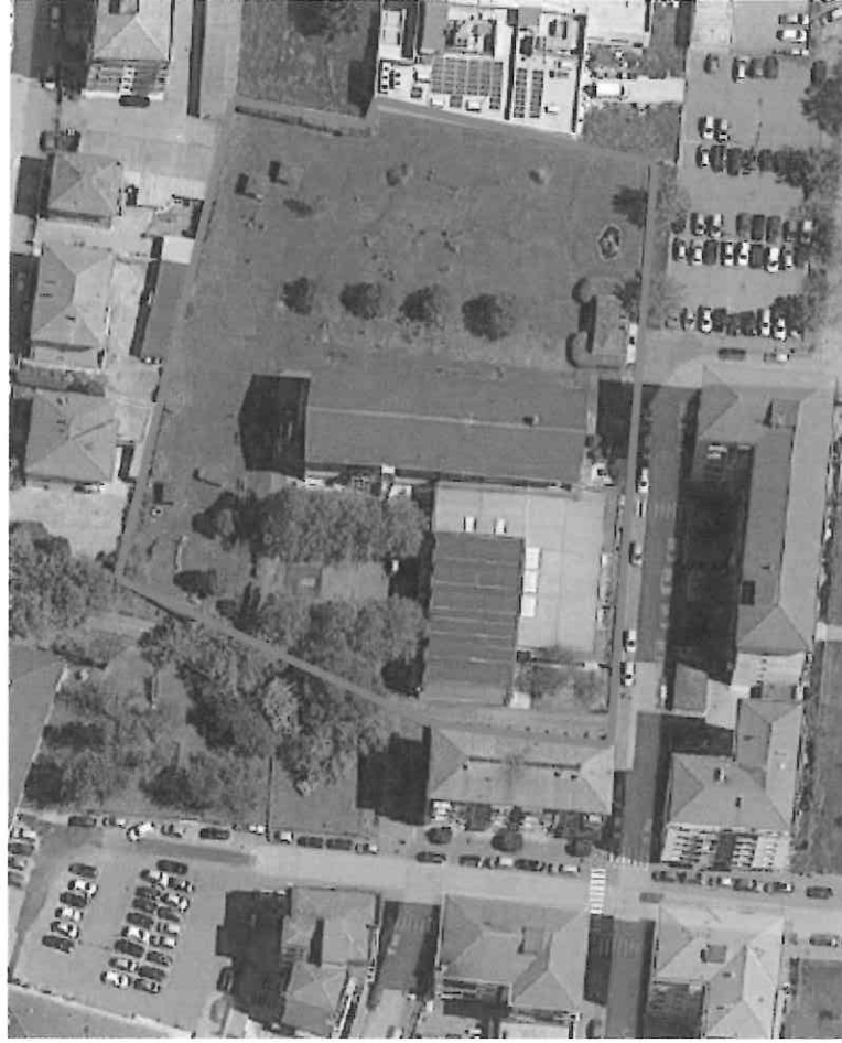
Scuola Elementare "Bistolfi"